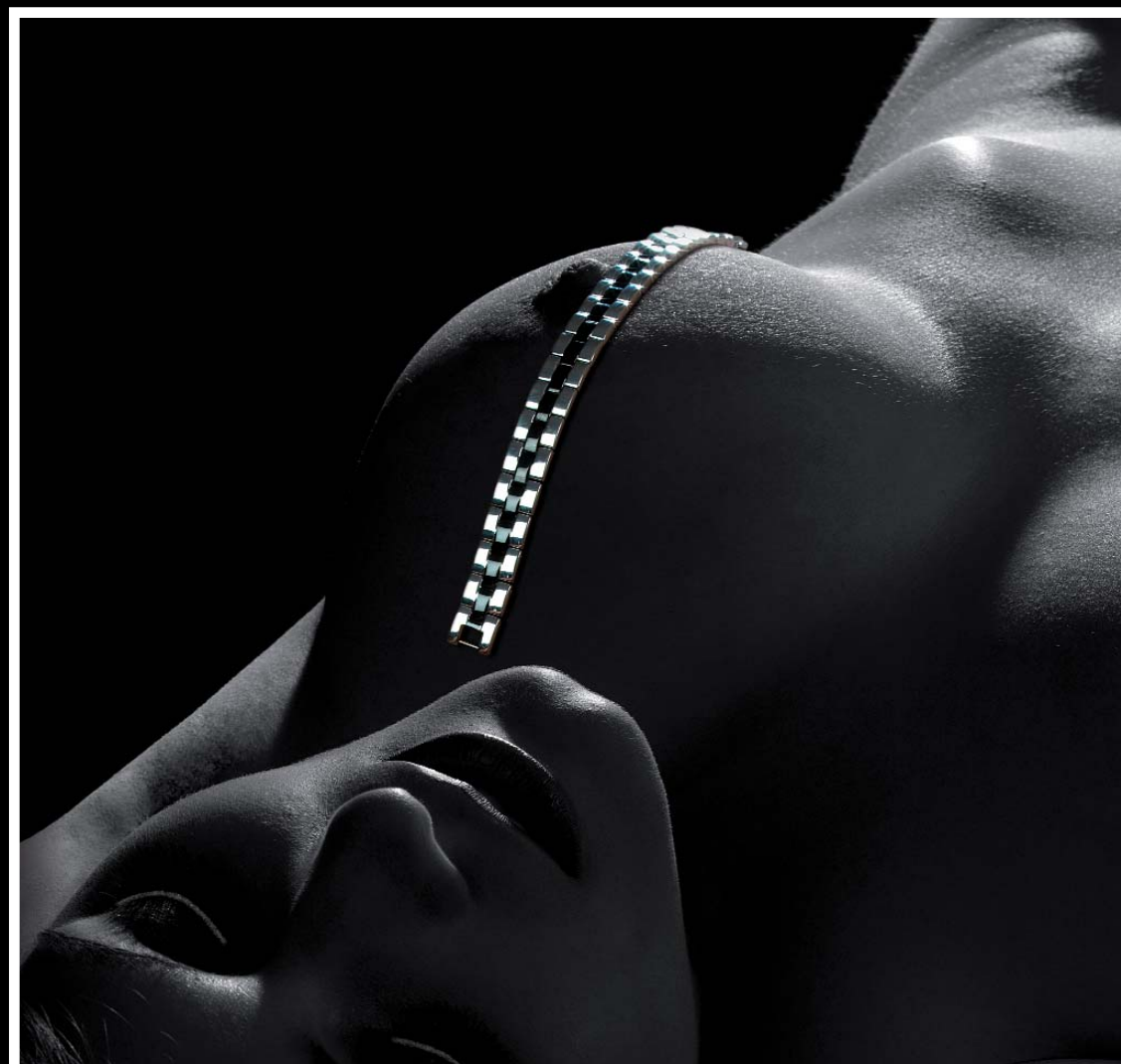
HERREN-ARMBAND schwarz/edelstahl 20,5 cm länge Artikelnummer: 19092 € 173,-